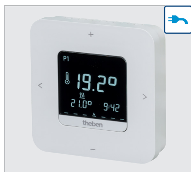
RAM812 top3 16A