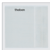
907.0.459, sonde de température ambiante, IP 65