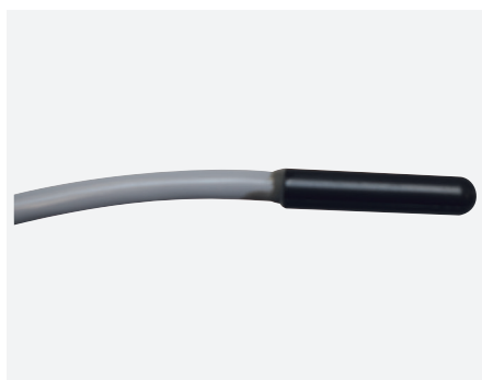
3128 (2 m) 3218 6M (6 m)